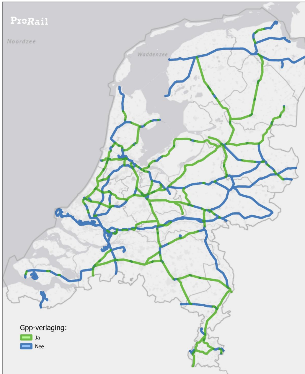
Figuur 2: Resultaten

In onderstaande figuur zijn de trajecten weergegeven waarvoor een gpp-verlaging mogelijk is (groen). Voor de gebieden waar een verlaging niet mogelijk is blijven de huidige geluidbrongegevens in het geluidregister gehandhaafd (blauw).