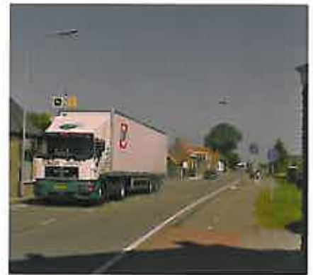
Situatie voor maatregelen