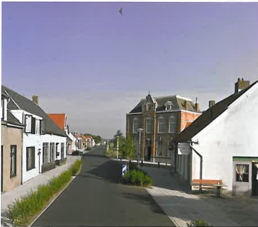
Situatie na maatregelen